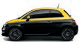
433 Vesuvio Schwarz / Sole Gelb