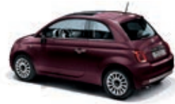
866 Opera Bordeaux