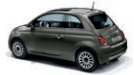
372 Colosseo Grau