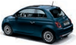
687 Dipinto di blu Blau