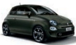
149 Alpen-Grün Matt (mit 6U9)