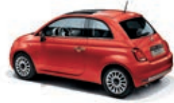
552 Corallo Rot