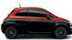
246 Vesuvio Schwarz / Passione Rot