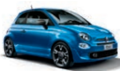
425 Italia Blau