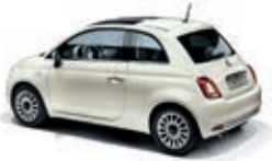
227 Ghiaccio Weiss