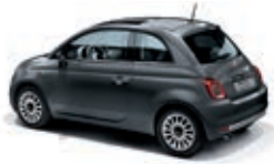
695 Pompei Grau